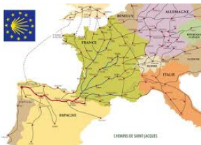
Routes naar de "Camino De Santiago"

"Het is echt bijzonder, hoe je het ook went of keert!"