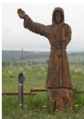
Een Pelgrim wijst de weg .... !